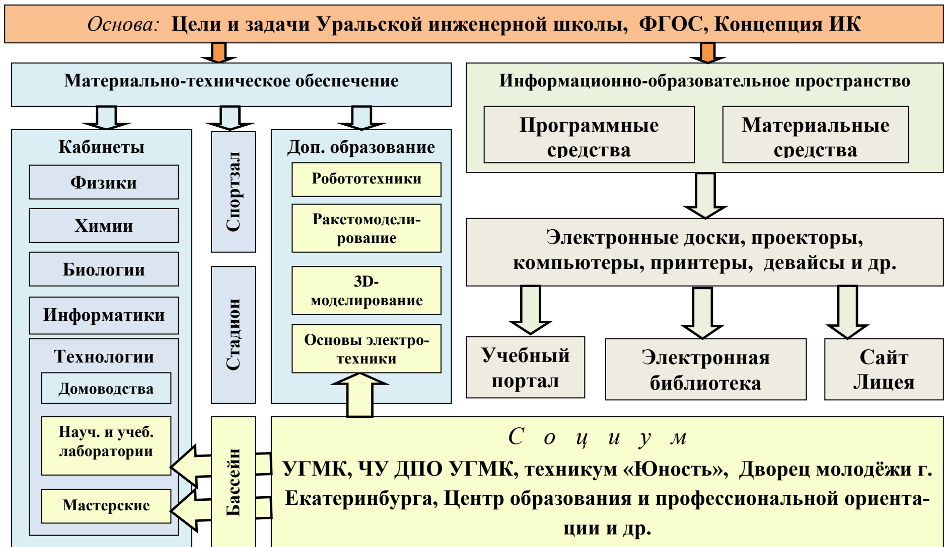
Рис. 2. Материально-техническое обеспечение реализации проекта «Инженерный лицей»