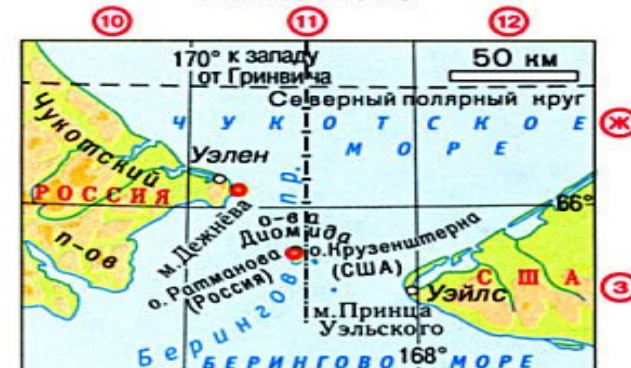
мыс Дежнёва - 169^{\circ}40' в.д. Восточное побережье острова Ратманова - 169^{\circ}02' в.д.