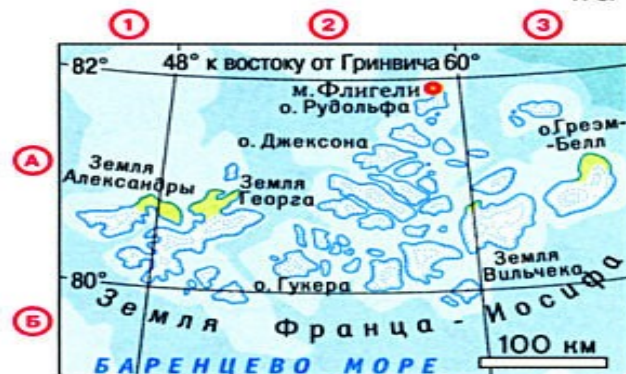
мыс Флигели на острове Рудольфа - 81^{\circ}51' с.ш.