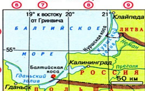
на Балтийской косе - 19^{\circ}38' в.д.