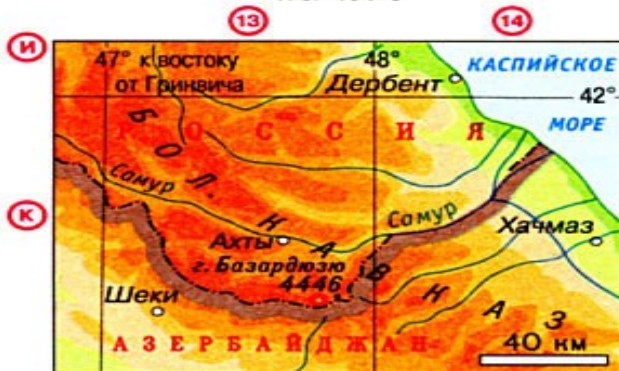
к юго-западу от горы Базардюзю - 41^{\circ}10' с.ш.