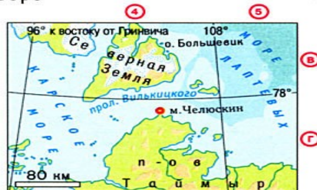
мыс Челюскин - 77^{\circ}43' с.ш.